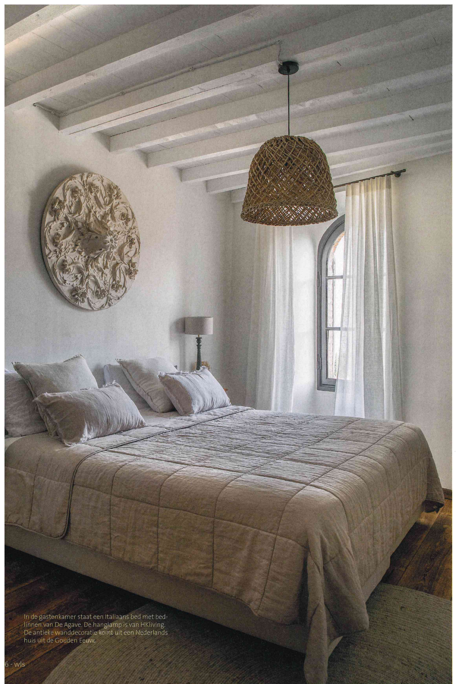
In de gastenkamer staat een Italiaans bed met bedlinnen van De Agave. De hanglamp is van HKliving. De antieke wanddecoratie komt uit een Nederlands huis uit de Gouden Eeuw.