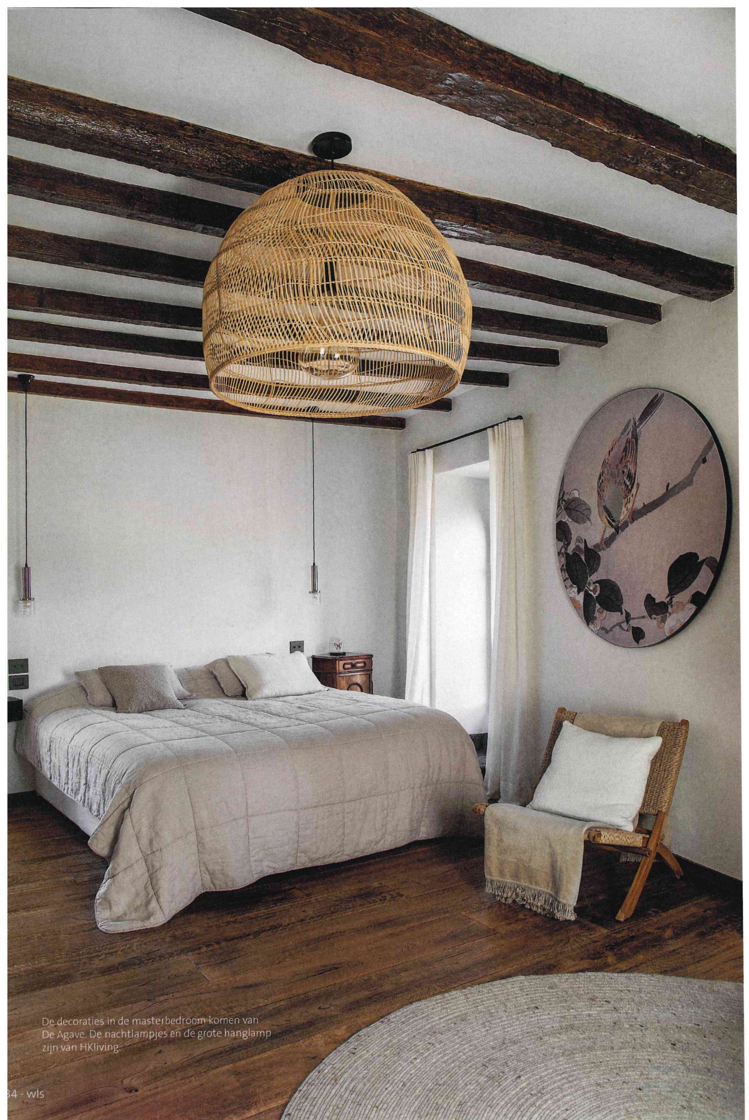
De decoraties in de masterbedroom komen van De Agave. De nachtlampjes en de grote hanglamp zijn van HKliving.