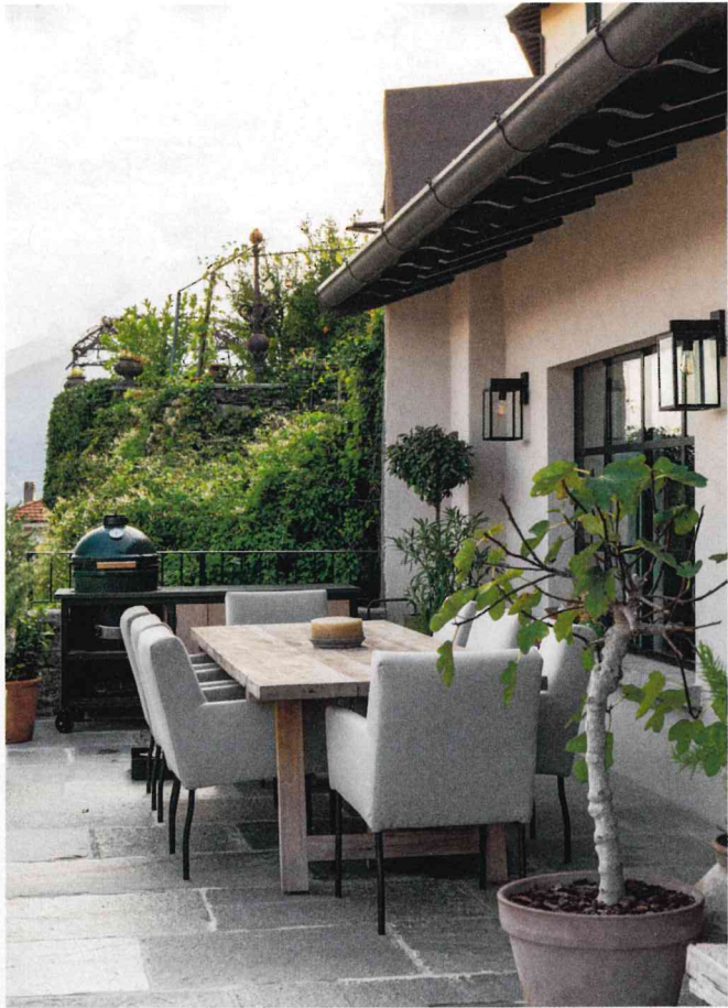
Het terras bevindt zich in het verlengde van de woonkamer. Het buitenmeubilair komt van De Agave. De barbecue is van Green Egg.