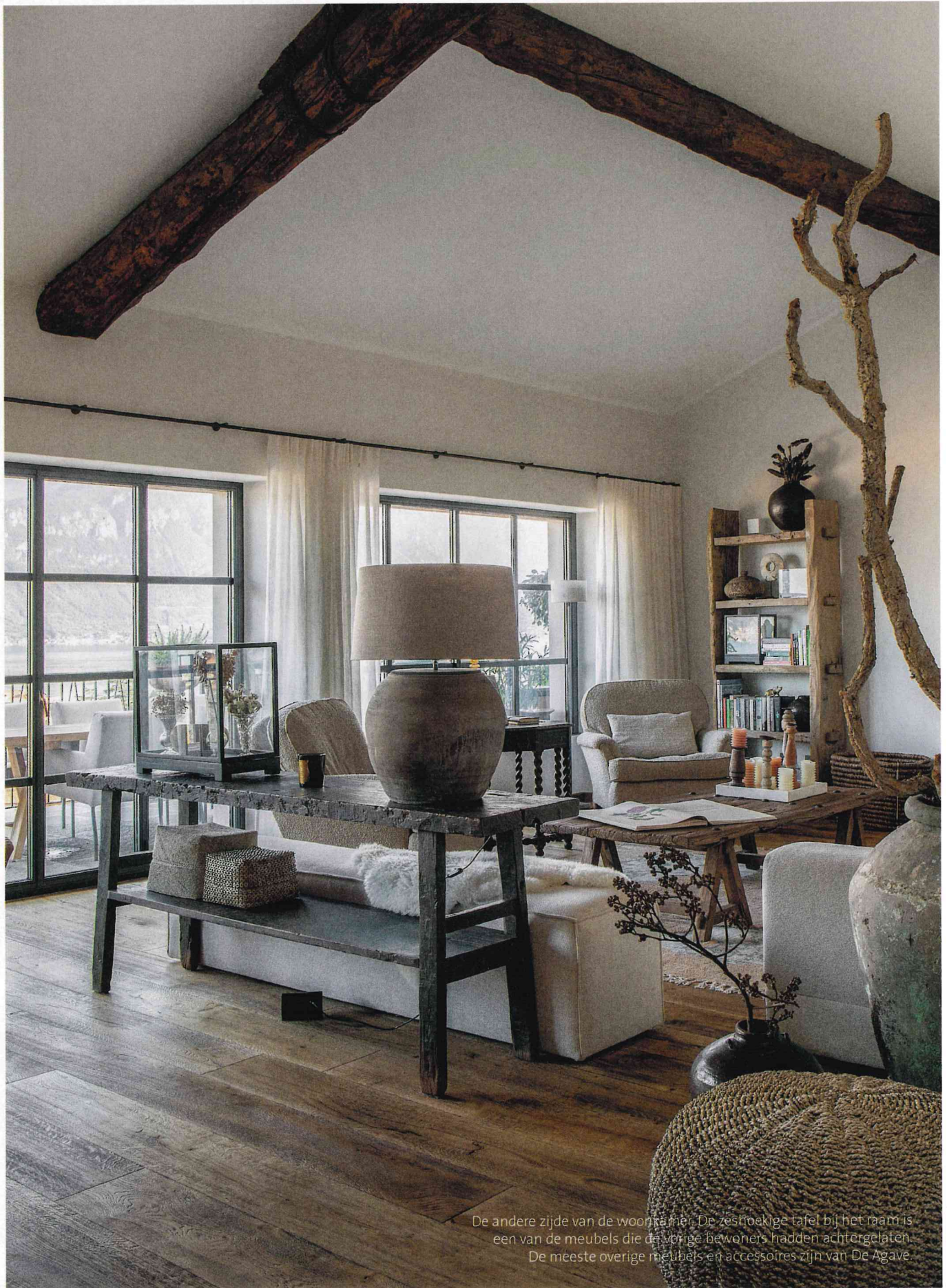
De andere zijde van de woonkamer. De zeshoekige tafel bij het raam is een van de meubels die de vorige bewoners hadden achtergelaten. De meeste overige meubels en accessoires zijn van De Agave.